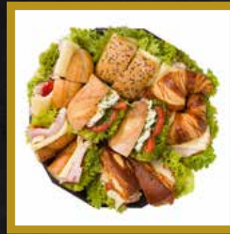
SCHMANKERL PLATTE für 5-6 Personen

Kleine Baguette mit Schinken & Käse Mehrkornweckerl mit Gouda Kornspitz mit Schinken & Käse Laugencroissant mit Schinken & Käse Baguette mit Ei aufstrich Laugenecke mit schwarzer Pute