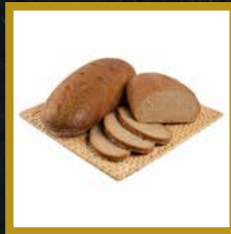
HAUSBROT 1kg Stück