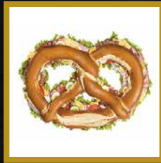
PARTYBREZE GEFÜLLT für 6-8 Personen

Kümmelbraten Kärntner Bauernschinken Polnische Spezial Saunaschinken Schwarzwälder Schinken Bergbaron, Moosbacher Basil Chili-Paprika Österr. Emmentaler