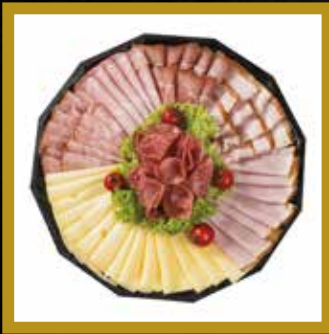
RUSTIKALE BAUERNPLATTE für 5-6 Personen

Kärntner Bauernschinken Schwarzwälder Schinken Kümmelbraten Haussalami Backofenschinken Polnische Spezial Moosbacher Gouda