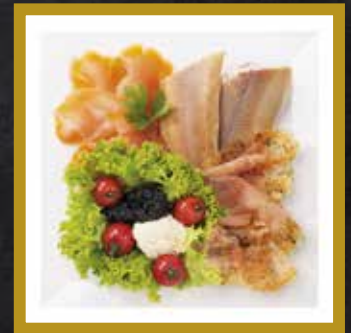
RÄUCHERFISCH PLATTE für 2-3 Personen

Norsson Gravad Lachs Räucherlachs Forellenfilet Oberskren Kaviarersatz