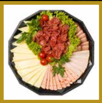
WURST-KÄSE PLATTE für 5-6 Personen

Schwarzwälder Wurst Haussalami Pikantwurst Saunaschinken Bergbaron Gouda