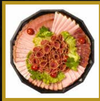
SPEZIALITÄTEN PLATTE für 6-7 Personen

Käsewurst Farmerschinken Backofenschinken Schwarzwälder Schinken Prosciutto Spanische Putenbrust Neuburger Knoblauchsalami