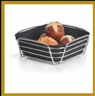
GEBÄCKKORB* KLEIN 5 Stück, gemischt