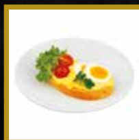
EI AUFSTRICH BRÖTCHEN