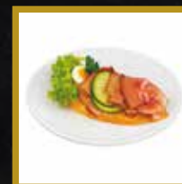
SCHWARZWÄLDER SCHINKEN BRÖTCHEN