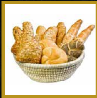
GEBÄCKKORB* GROSS 10 Stück, gemischt