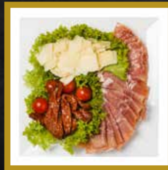
ANTIPASTI PLATTE für 2-3 Personen

Prosciutto Grana Padano Flocken Getrocknete Tomaten Salami Milano