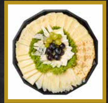
KÄSE PLATTE für 5-6 Personen

Österreichischer Emmentaler Bergbaron Bio Tilsiter Gouda Brie la Belle Laitiere Österkron Basil Chili-Paprika